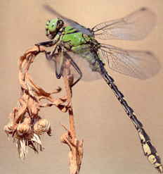
Le gomphus serpentin, lié aux grands méandres, n'est plus vu sur ses stations de la rivière Loire, mais reste présent dans les départements de l'Allier et de la Haute-Loire.

Plus d'informations : www.groupeodonat.auvergne.fr