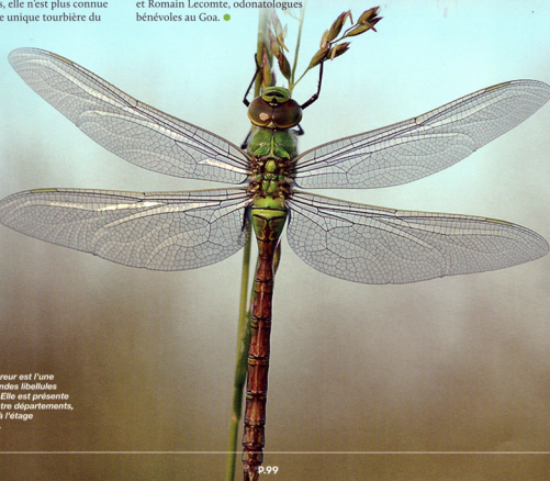
L'anax empereur est l'une des plus grandes libellules d'Auvergne. Elle est présente dans les quatre départements, de la plaine à l'étage montagnard.